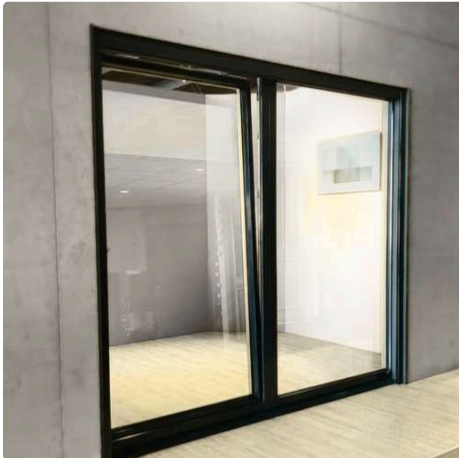
Porte-fenêtre coulissante à translation automatique