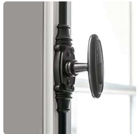
Fausse crémonne à l'ancienne