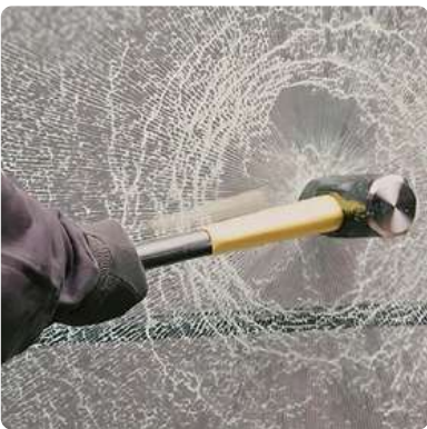
Vitrage retardateur d'effraction 44/2 ; SP10...