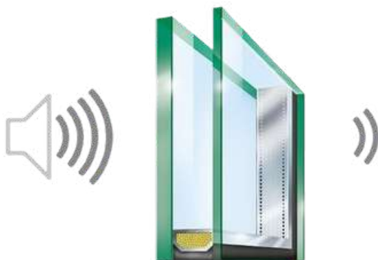
Double ou triple vitrage phonique