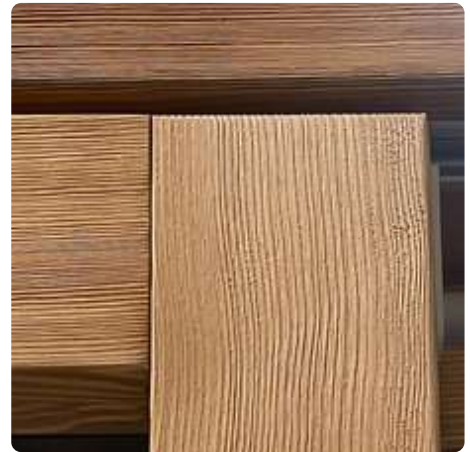
Le Bois brossé, une ou deux faces