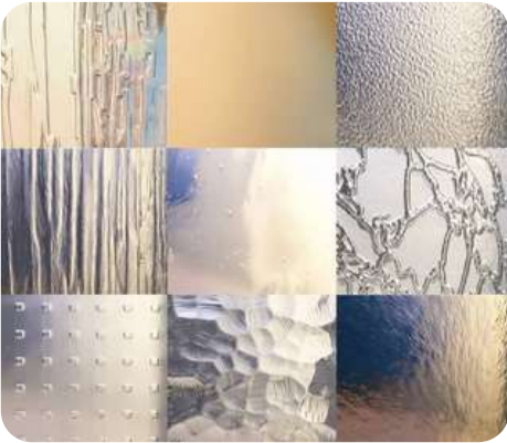
Différents vitrages décoratifs