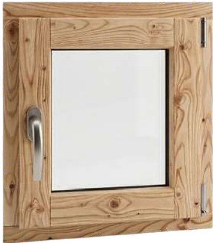
Plusieurs choix d'essence de bois