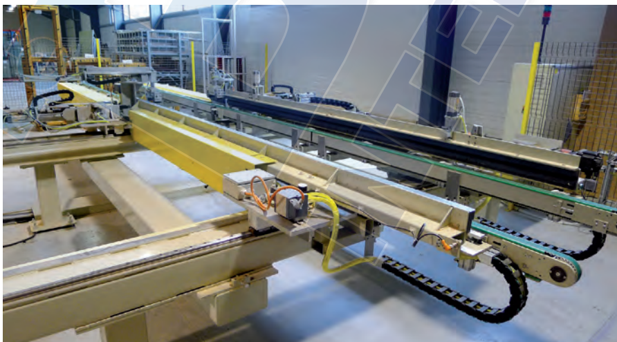
Une machine française chez Eurofen : la station de cadrage à plat MTL.