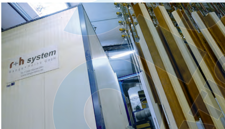
Dans sa nouvelle usine, Eurofen est équipé d'une ligne de peinture Range+Heine.

Pour l'assemblage et le cadrage des montants de fenêtres, le menuisier opère avec une station de cadrage française à commandes numériques de marque MTI. Les finitions bois d'Eurofen se déclinent selon les pigments de la gamme RAL, obéissant à une normalisation européenne et permettant à chacun de s'y retrouver dans le langage compliqué des couleurs. "Contrairement à la concurrence, nous proposons toute la gamme RAL, soit plus de 200 couleurs différentes", soutient Pascal Tissot.