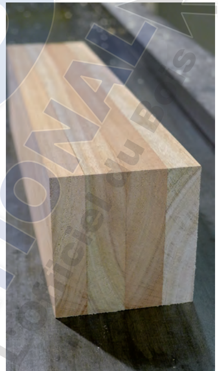
Eurofen utilise des carrelots 4 plis en eucalyptus red grandis d'Uruguay.

Ainsi, pour ses finitions, Eurofen utilise une peinture en phase aqueuse. Après usage, les poudres sont séparées et recyclées par le fournisseur Sikkens, l'eau purifiée retournant à l'égout. Le même processus se déroule dans les circuits pneumatiques, les huiles également séparées de l'eau, sont retraitées. De plus, afin de consommer moins d'énergie, la chaleur de deux compresseurs électriques est