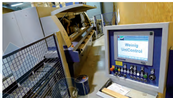
Le centre d'usage Weinig entièrement automatisé.

dites "classiques", de formes droites, rectangulaires, trapézoïdales.