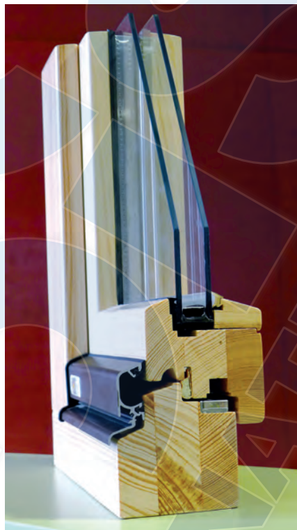
Les fenêtres Eurofen, des produits techniques.